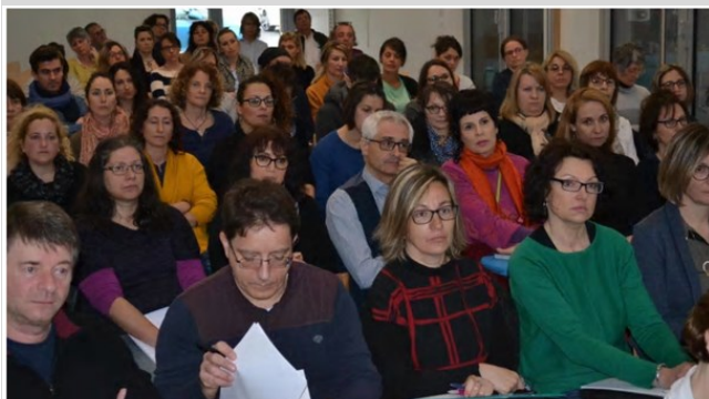
Médecins, psychologues, éducateurs et professionnels de la petite enfance de tous horizons étaient réunis, mercredi, au siège de l'Adapei, pour découvrir cette nouvelle formation.

Ainsi, le 6 mars 2019, le centre hospitalier de Châteauroux-Le Blanc a participé à l'ouverture de la formation départementale « Autisme et TSA », financée par une enveloppe spécifique de l'ARS 36. Cette formation engage fortement de nombreux professionnels du territoire à l'organisation de réponses adaptées aux besoins spécifiques de cette population ; ainsi elle est ouverte à 61 professionnels du département de l'Indre, dont deux infirmières du service de psychiatrie infanto-juvénile.