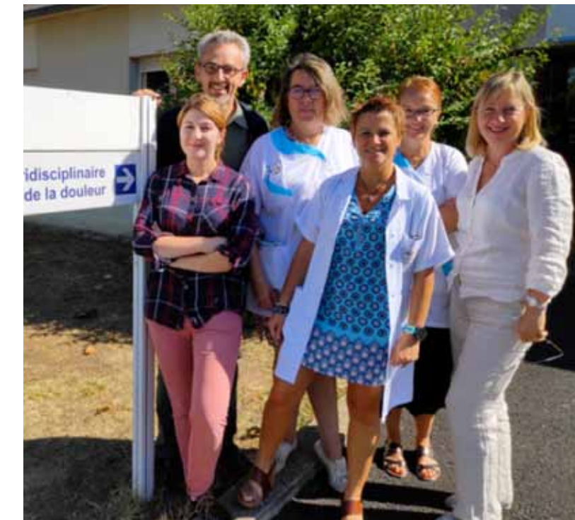
Le service de Consultation pluridisciplinaire de la douleur