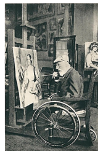
(Pierre-Auguste Renoir avait 56 ans, quand il fut frappé de polyarthrite rhumatoïde)

De grandes avancées cliniques, de diagnostics et thérapeutiques ont permis d'améliorer grandement sa prise en charge.