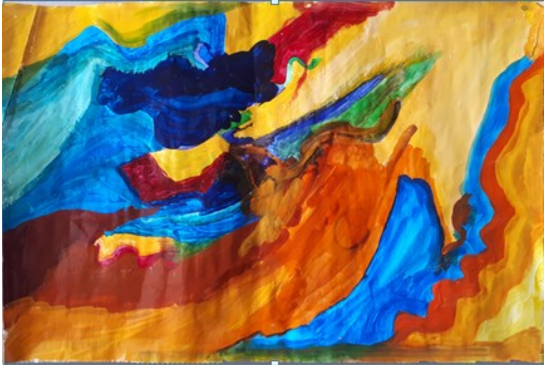
Méditation n° 1 par Adeline