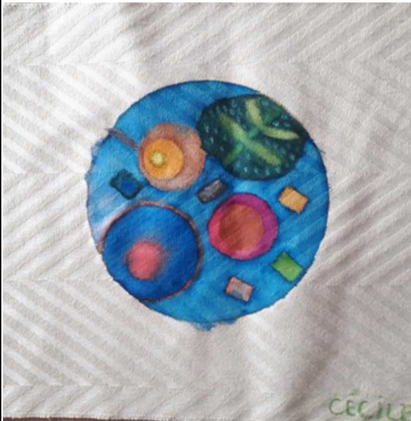
Méditation n° 2 Planète ethnique par Cécile